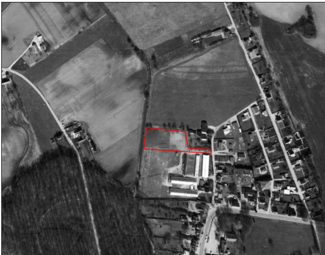
Nr. 14: Luftfoto 1967. Ålykkevej 7B og arealer nord for anvendes til landbrugsdrift. Arealer syd for benyttes til gartneri. Sti kan umiddelbart ikke erkendes i terrænet. Luftfotos kan tilgås via Gribskov Kommunes digitale kort https://gribskov.dk/om-kommunen/byudvikling-og-planlaegning/digitalt-kort .