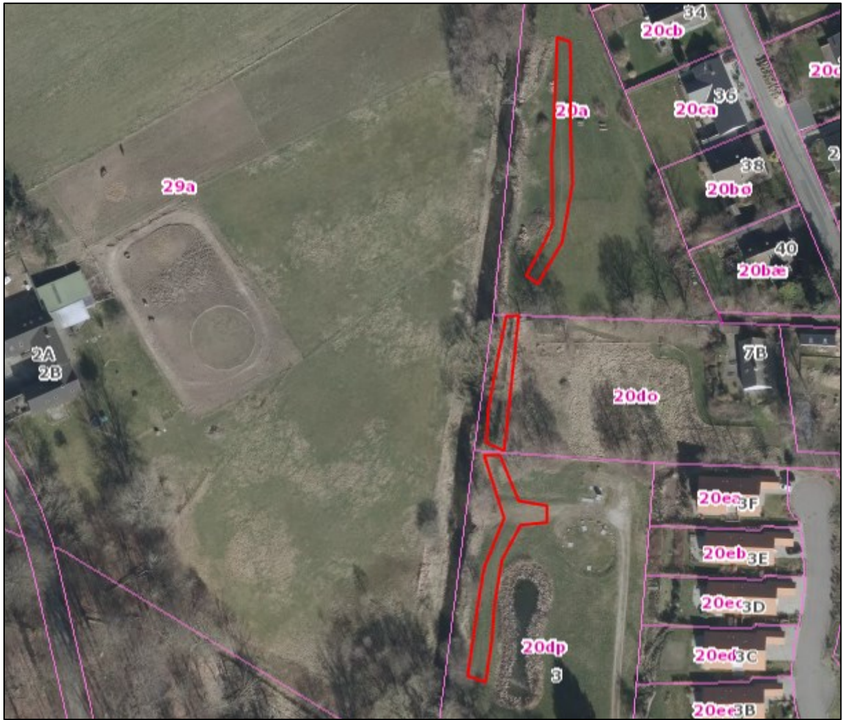
Nr. 8: Luftfoto 2014. Trampespor (linjeformede elementer) på G/F-fællesarealer mod nord, Ålykkevej 7B og arealer syd for Ålykkevej 7B. Luftfotos kan tilgås via Gribskov Kommunes digitale kort https://gribskov.dk/om-kommunen/byudvikling-og-planlaegning/digitalt-kort .