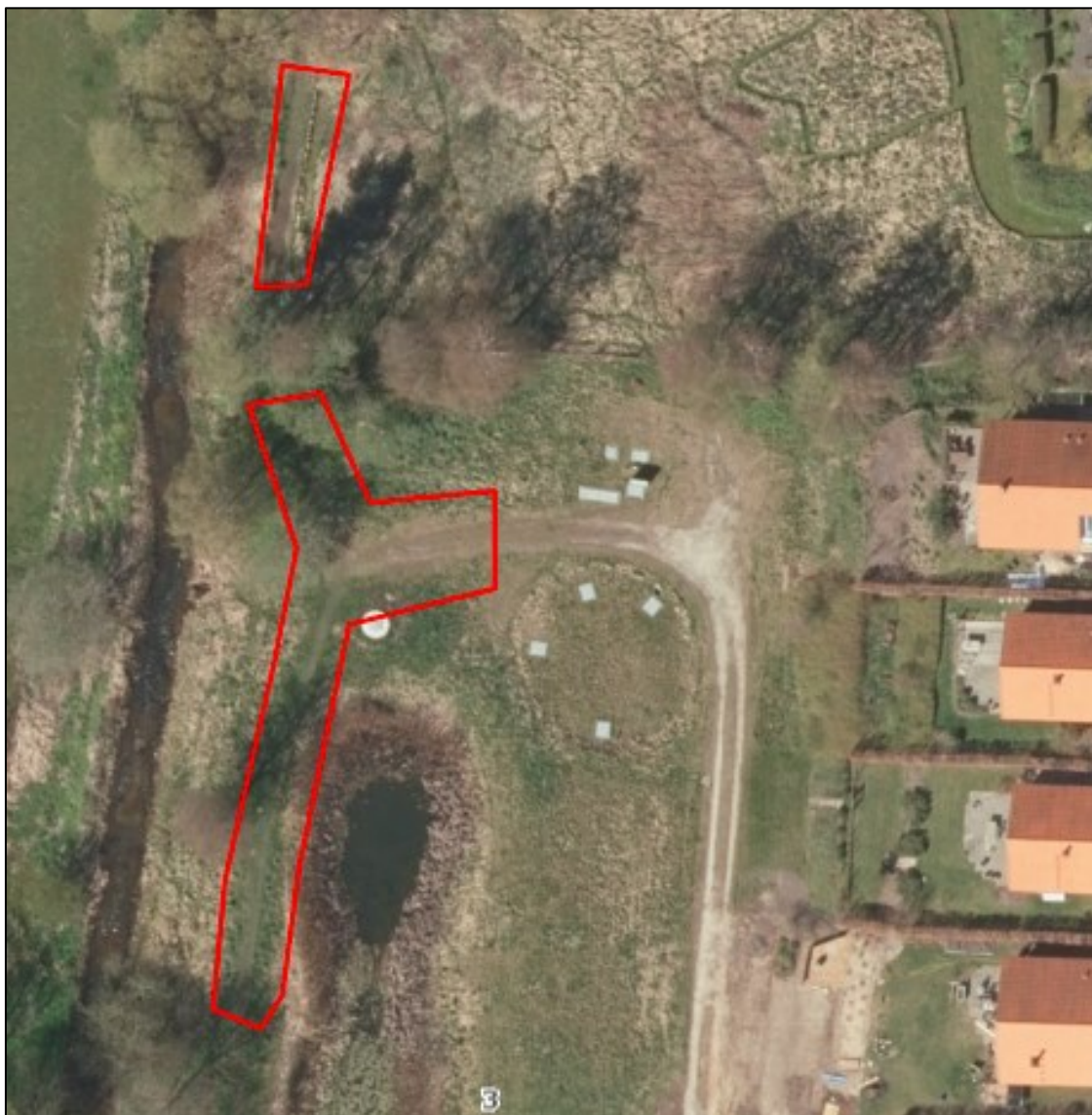
Nr. 3: Luftfoto 2017. Trampespor/færdselsslid kan ses på Ålykkevej 7B og arealer syd for. Det er sandsynligvis dyrehegn der ses på stiens vestlige side. Der var adgang i 2017, hvor ejendom ikke endnu var overdraget til nye ejere. Luftfotos kan tilgås via Gribskov Kommunes digitale kort https://gribskov.dk/om-kommunen/byudvikling-og-planlaegning/digitalt-kort .