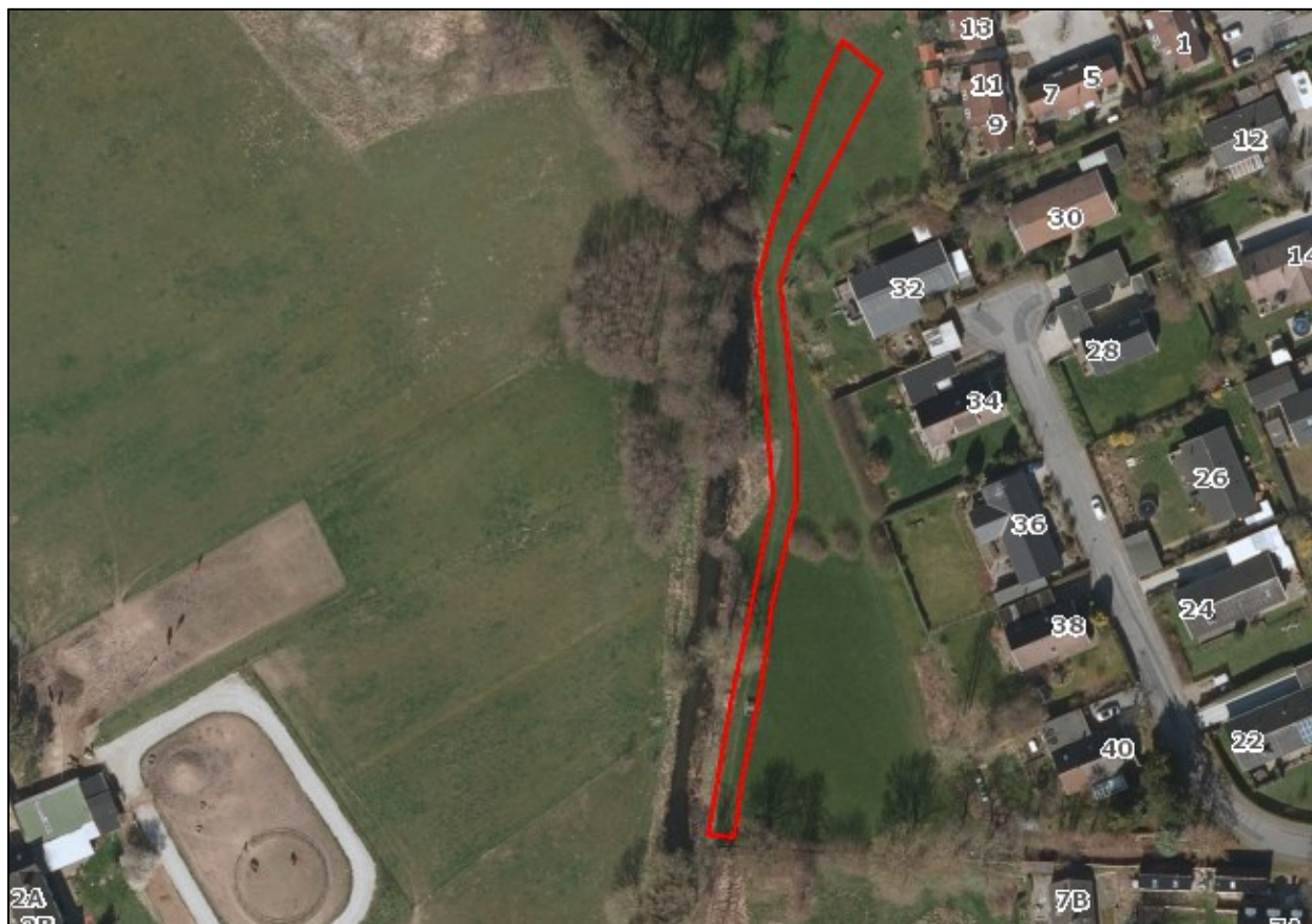
Nr. 1: Luftfoto 2019. Tydeligt trampespor på G/F-fællesarealer i retning mod Ålykkevej 7B. Luftfotos kan tilgås via Gribskov Kommunes digitale kort https://gribskov.dk/om-kommunen/byudvikling-og-planlaegning/digitalt-kort .

Bilag 2: Gennemgang af luftfotos. Luftfotos er vedlagt og kommenteret på nedenfor. Kommunen henviser imidlertid til oprindelige luftfotos der bl.a. kan findes på Gribskov Kommunes netgis ( https://gribskov.dk/om-kommunen/byudvikling-og-planlaegning/digitalt-kort ) mhp. rette opløsning og mulighed for at zoome ind og ud på detaljer i terrænet.