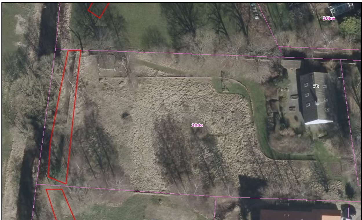
Nr. 7: Luftfoto 2014. Trampespor/færdselsslid på Ålykkevej 7B. Dyrehegn ses tydeligt på hele ejendommen. Luftfotos kan tilgås via Gribskov Kommunes digitale kort https://gribskov.dk/om-kommunen/byudvikling-og-planlaegning/digitalt-kort .