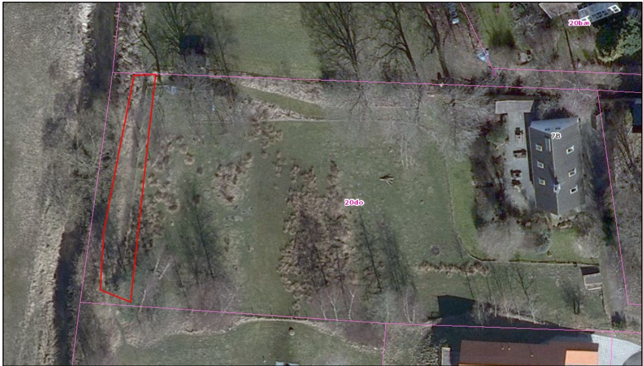
Nr. 11: Luftfoto 2009. Tydelige trampespor/færdselsslid på Ålykkevej 7B. Dyrehegn ses tydeligt på hele ejendommen. Luftfotos kan tilgås via Gribskov Kommunes digitale kort https://gribskov.dk/om-kommunen/byudvikling-og-planlaegning/digitalt-kort .