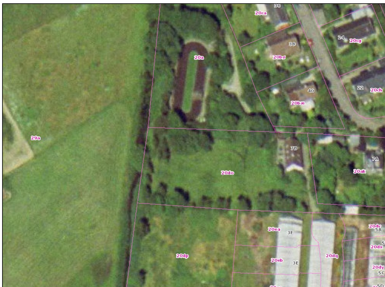
Nr. 13: Luftfoto 1999. Spildevandsanlæg på matr. 20a. Nedlagt på et tidspunkt i perioden 1999-2002. Anlægget har formodentligt været heget. Luftfotos kan tilgås via Gribskov Kommunes digitale kort https://gribskov.dk/om-kommunen/byudvikling-og-planlaegning/digitalt-kort .