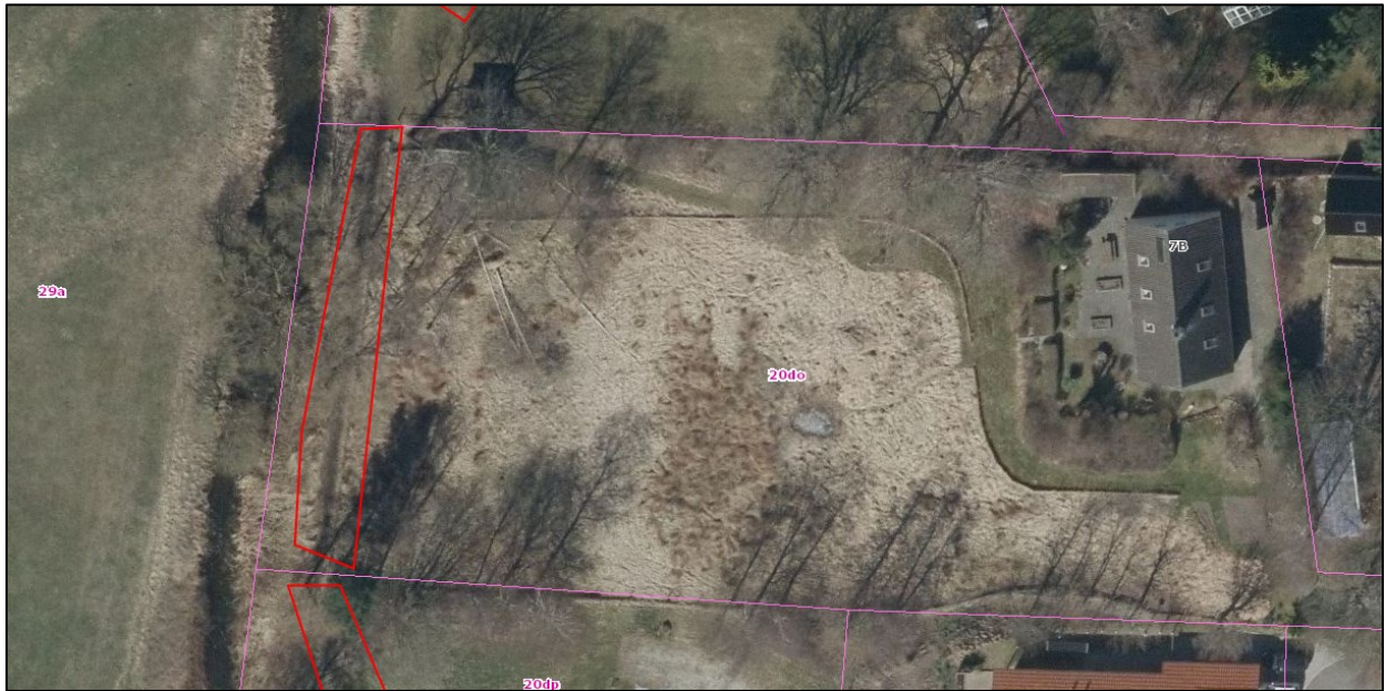
Nr. 9: Luftfoto 2013. Tydelige trampespor/færdselslid på Ålykkevej 7B. Dyrehegn ses tydeligt på hele ejendommen. Luftfotos kan tilgås via Gribskov Kommunes digitale kort https://gribskov.dk/om-kommunen/byudvikling-og-planlaegning/digitalt-kort .