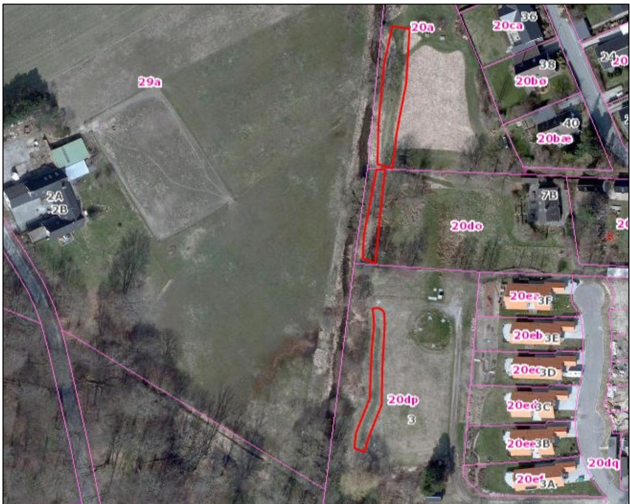
Nr. 10: Luftfoto 2010. Trampespor (linjeformede elementer) på Ålykkevej 7B og arealer syd for Ålykkevej 7B. På G/F-arealer mod nord er der spor efter slåning i retning mod Ålykkevej 7B. Luftfotos kan tilgås via Gribskov Kommunes digitale kort https://gribskov.dk/om-kommunen/byudvikling-og-planlaegning/digitalt-kort .