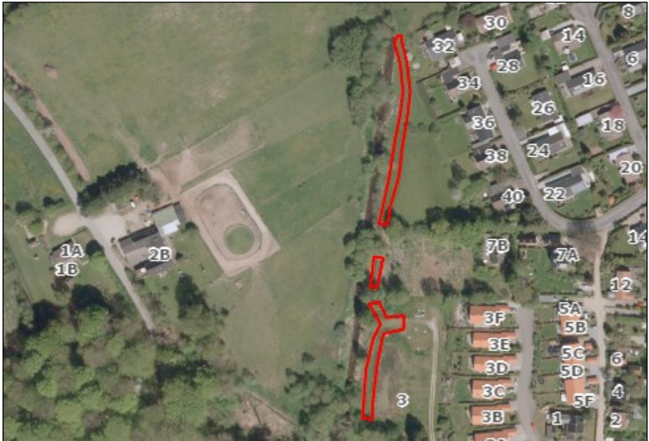
Nr. 2: Luftfoto 2018. Tydelige trampespor på G/F-fællesarealer og arealer syd for Ålykkevej 7 B. Trampesti antydes på Ålykkevej 7B. Luftfotos kan tilgås via Gribskov Kommunes digitale kort https://gribskov.dk/om-kommunen/byudvikling-og-planlaegning/digitalt-kort .