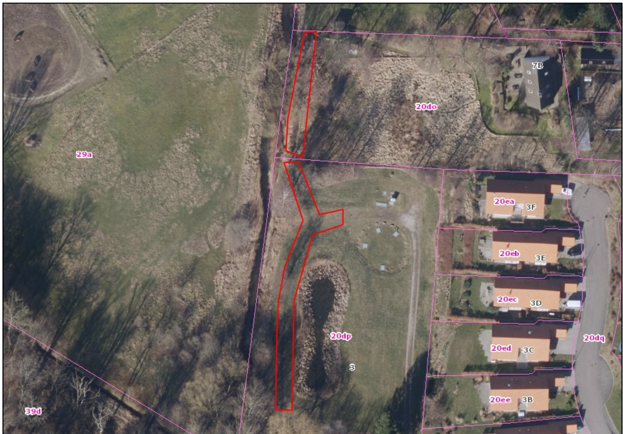
Nr. 6: Luftfoto 2015. Trampespor (linjeformede elementer) på Ålykkevej 7B og arealer syd for Ålykkevej 7B. Luftfotos kan tilgås via Gribskov Kommunes digitale kort https://gribskov.dk/om-kommunen/byudvikling-og-planlaegning/digitalt-kort .