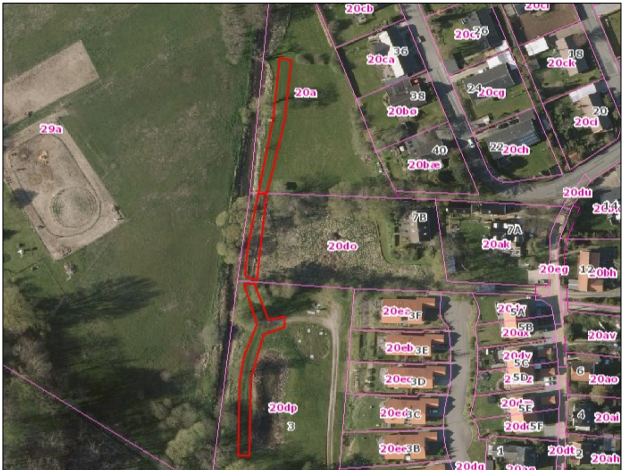
Nr. 5: Luftfoto 2016. Trampespor (linjeformede elementer) på G/F-fællesarealer, Ålykkevej 7B og arealer syd for Ålykkevej 7B. Dyrehegn ses på stiens vestlige side og oppe ved beboelsesejendommen. Luftfotos kan tilgås via Gribskov Kommunes digitale kort https://gribskov.dk/om-kommunen/byudvikling-og-planlaegning/digitalt-kort .